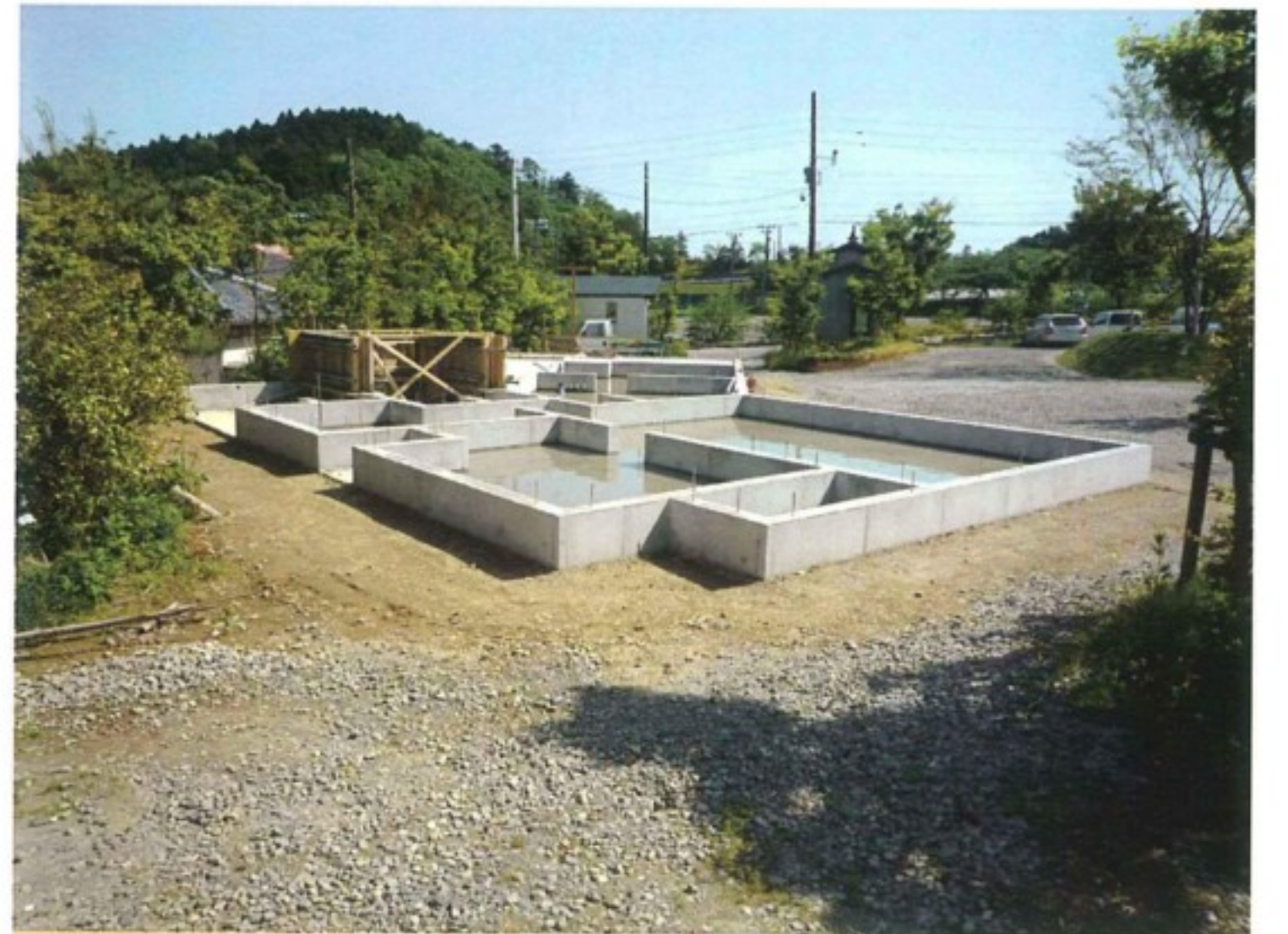
▲ 5月21日(木)時点で基礎工事もほぼ終わり、墨付け・刻みが終わり次第建てていきます。